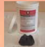
PM Hoof Packing Regular

For Treatment of All Horn Crack Varieties: PM Hoof Clip Completely Set