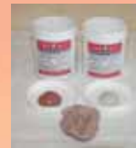
PM Hoof Packing Soft